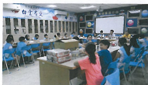
環保小局長與校長及承辦處室一起討論