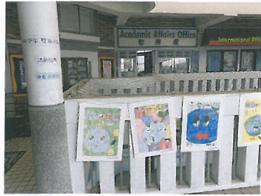
環保小局長藝文繪畫作品懸掛於走廊展示