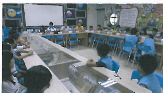
校內自治市環保小局長開會照片