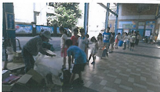
107 學年度結業式前回收與環境清潔