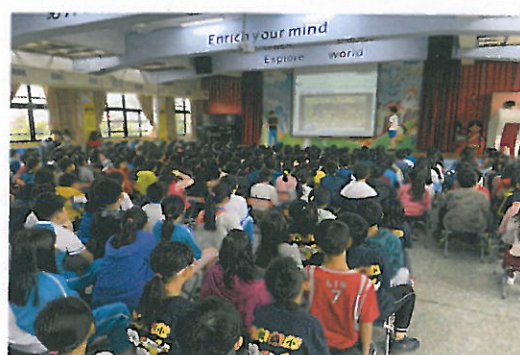
自治市環保局長及副局長兒童朝會進行資源回收及垃圾分類宣導