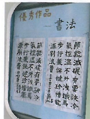
結合校內語文競賽-書法比賽