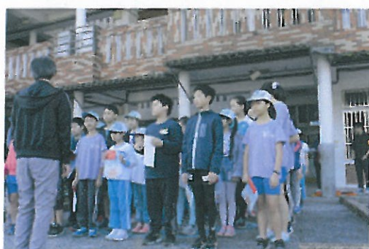
環保小局長藝文競賽頒發獎狀及禮券