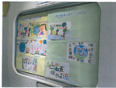
環保小局長藝文競賽-環保標語設計展示