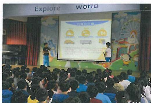
自治市環保局長及副局長兒童朝會進行資源回收及垃圾分類宣導