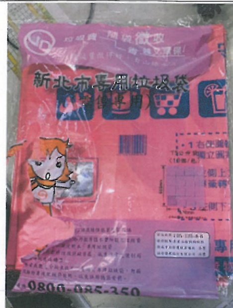
新北市專用垃圾袋採購