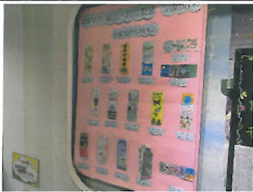
環保小局長藝文競賽-書籤設計展示