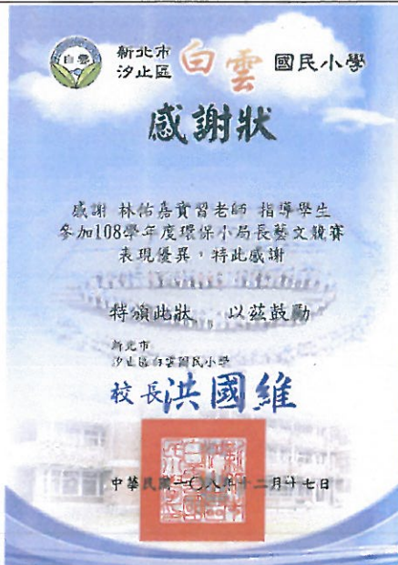
環保小局長藝文競賽指導老師感謝狀