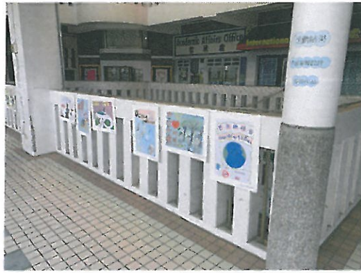
環保小局長設計海報懸掛於走廊展示