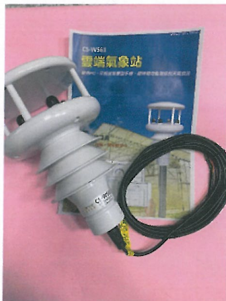
氣象觀測儀採購，作為本校教學使用