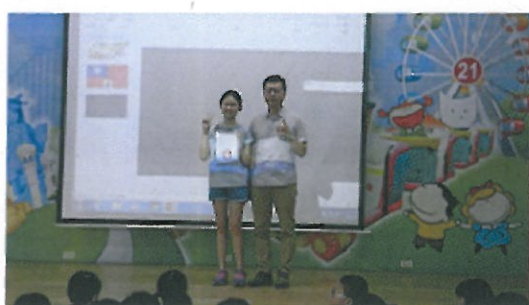
朝會頒發學生環保海洋詩得獎獎狀