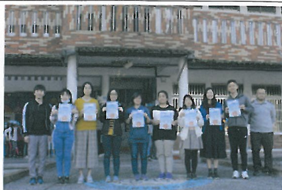
環保小局長頒發感謝狀給指導老師