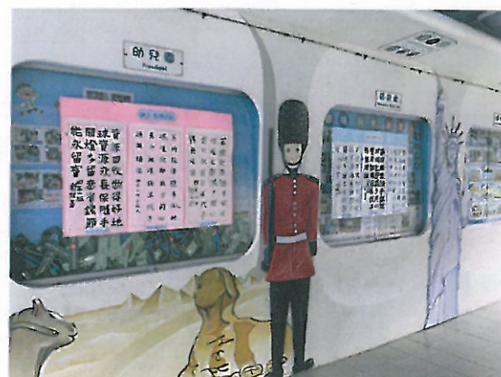
書法作品張貼於穿堂展示