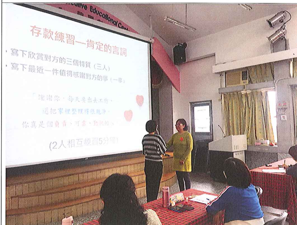
存款練習：肯定對方的三個特質，並寫下最近值得感謝對方的一件事。