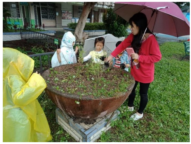
校園綠美化-種植苗木