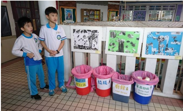
校慶園遊會減塑活動