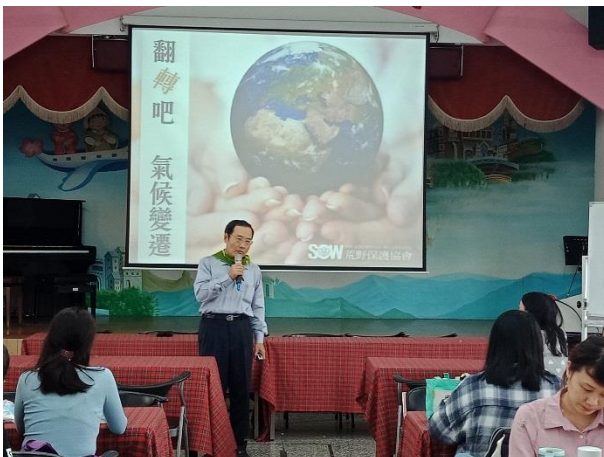
環境教育教師研習活動—翻滾吧！氣候變遷