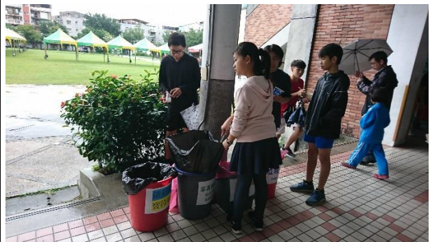
校慶園遊會減塑活動