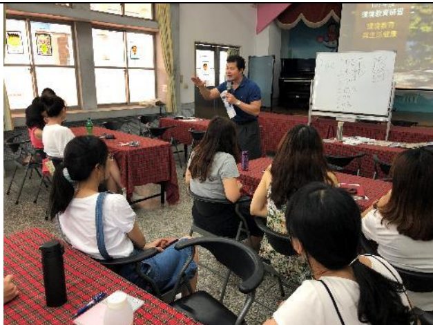
研習-環境教育與健康生活