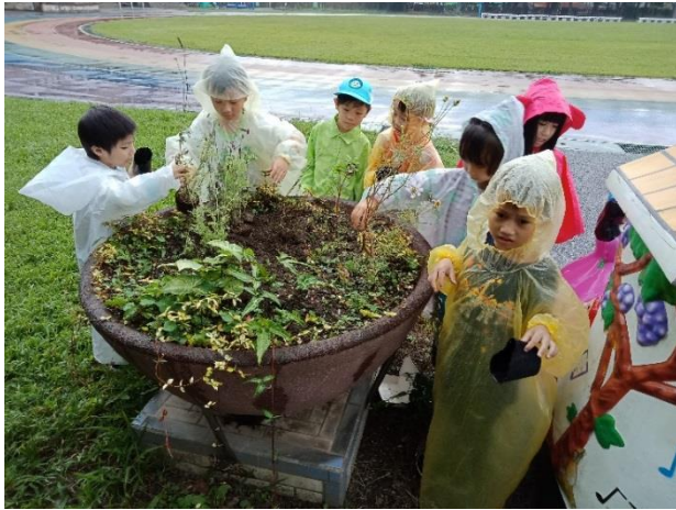
校園綠美化-種植苗木