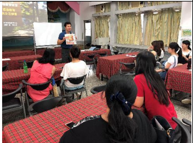
研習-環境教育與健康生活