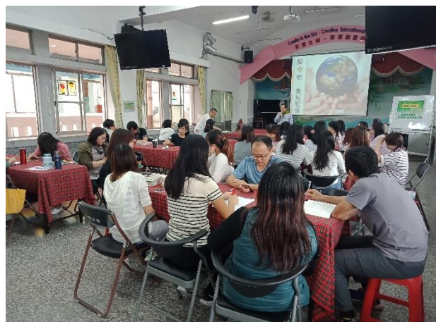
環境教育教師研習活動—翻滾吧！氣候變遷