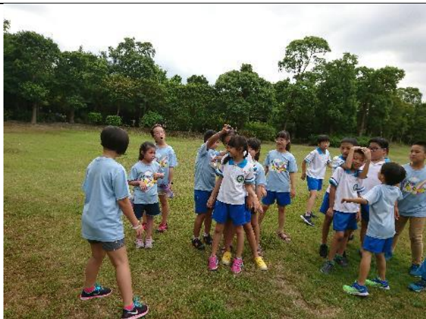
暑假-校外教學活動