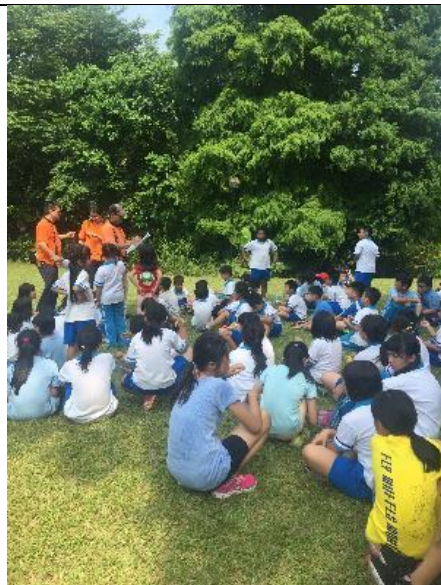
暑假-校外教學活動