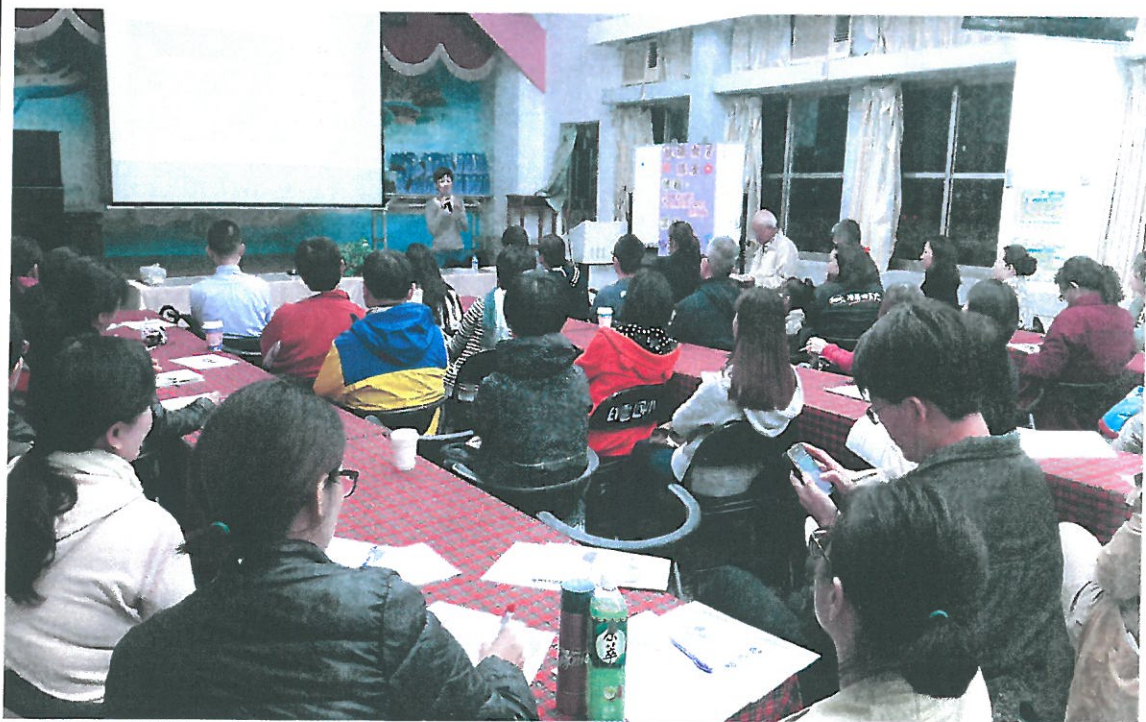
照片說明：透過實際案例分享，讓參與的家長學習如何透過語言與孩子進行溝通